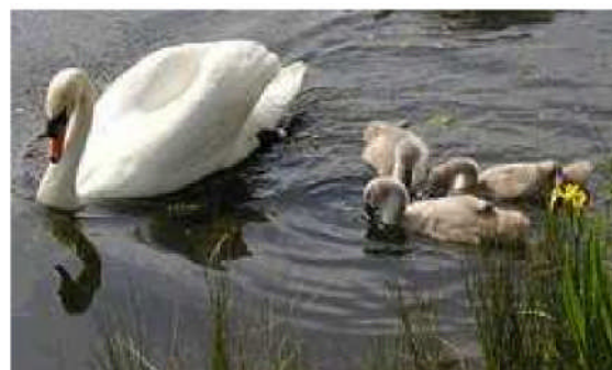
Östergötlands landskapsdjur: Knölsvan

Varje enskild kommun har olika regler för vilken ålder man ska ha uppnått för att få denna service.